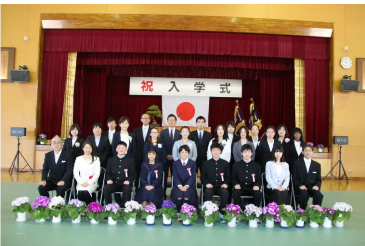
中学部 1 年生 入学式

僕たちは、小学校生活を終え、今日、知夫小中学校中学部に入学しました。今日から始まる中学部生活で、僕はまず勉強や部活についていけるかが不安です。理由は、勉強ではテスト期間や新しい教科が加わるからです。小学部の時と勉強のやり方も違うし、勉強の難しさも小学部の時とは違います。だから、勉強についていけるか不安です。部活動でも、先輩方についていけるか不安です。でも、一つひとつのことに集中して、授業も部活も駅伝も全隠岐陸上も体力作りも本気で取り組んでいきたいと思えます。好きなことだけでなく、嫌いなことも苦手なことも五人で協力していきます。「あきらめたら、そこで試合終了」。これは、小学部卒業式のスピーチで、僕が選んだ忘れられない言葉です。スピーチの中で、あきらめたら次がきつくなるということと、あきらめなかったら、次が楽になるということを伝えました。だから、中学部でも、授業や部活動をあきらめないように、毎日、この言葉を頭に入れて生活します。先生方や先輩方に、迷惑をかけてしまうこともあると思います。だけど、島留学生を入れた五人で、協力して何事もりこえていきます。これからの中学部生活を元気に楽しんでいきます。