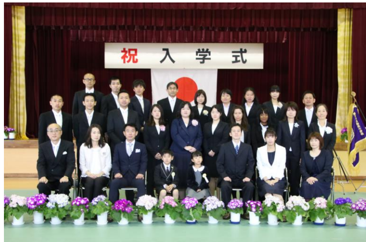
小学部 1 年生 入学式