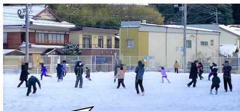
大雪の日 小中全校で雪合戦